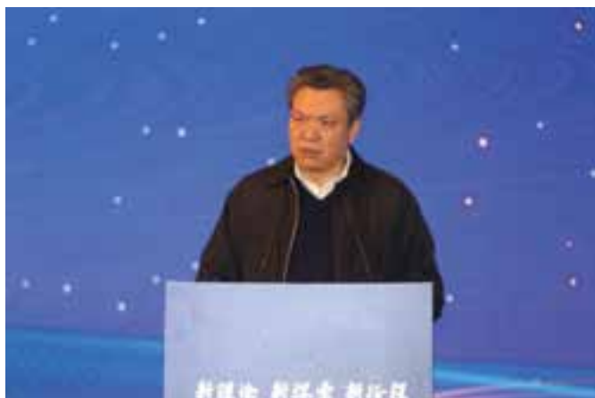
▲ 民政部法规司一级巡视员汤晋苏主旨演讲