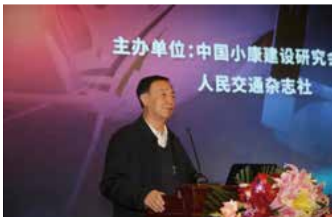
▲ 农业农村部乡村振兴专家咨询委员会委员、原农业部常务副部长、中国小康建设研究会高级专家尹成杰主旨演讲

中国小康建设研究会会长白长岗，中国小康建设研究会高级专家贺秉发，沈阳市政协原副主席庞洪波，中国民用航空局运输司原副司长廉秀琴，中航重机副总经理乔堃，人民交通杂志社社长郑德岭，辽宁省法库县委书记刘阳春，中国航空运输协会通用航空分会会长丁跃，中航国铁教育集团董事长戴晋权，中国民航管理干部学院通用航空系主任吕人力，大同轻型飞机制造有限公司董事长申定龙等领导出席大会。