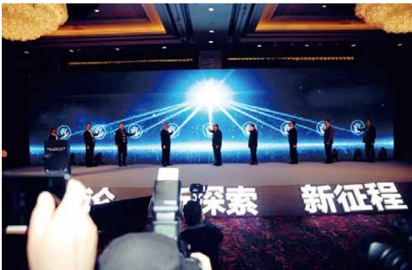
▲ 在第六届中国社会养老创新发展论坛举行“大同康养”品牌建设启动仪式