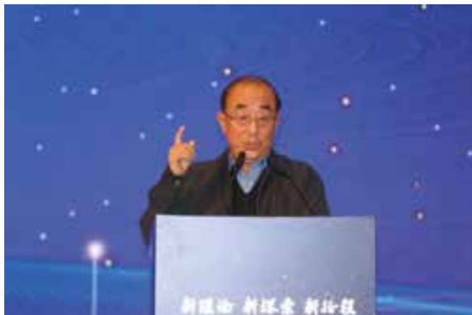
▲ 原卫生部部长高强主旨演讲