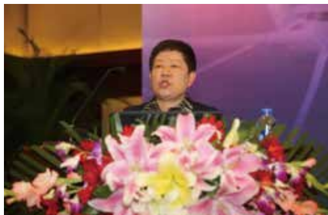
▲ 中国民用航空局运输司原副司长廉秀琴主旨演讲