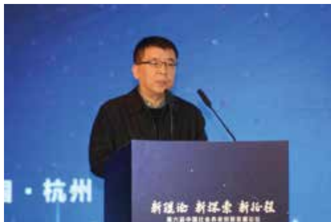
▲ 中国老龄产业协会会长曾琦主旨演讲