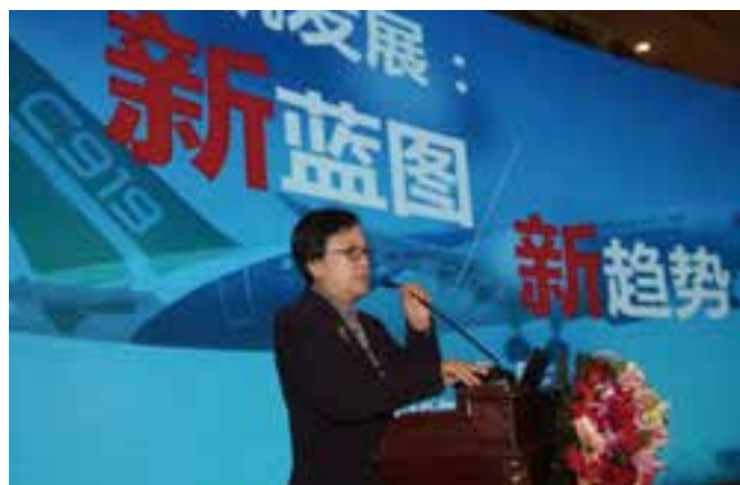
▲ 教育部原副部长鲁昕主旨演讲