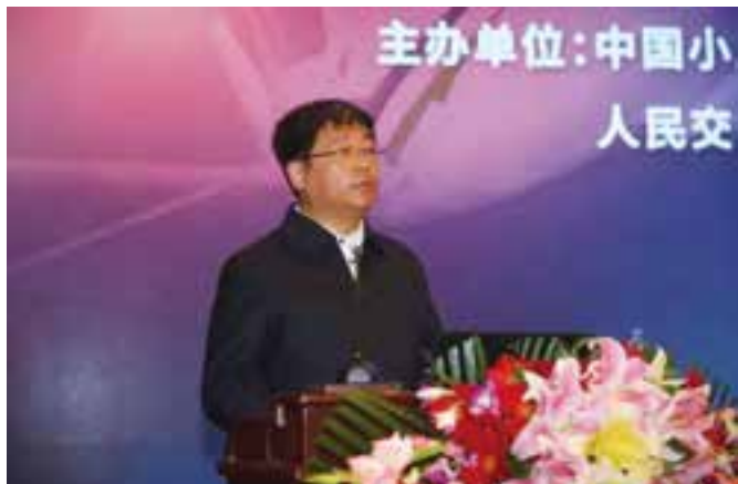
▲ 辽宁省法库县委书记刘阳春作为主办方发言