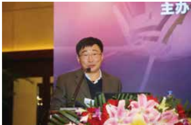
▲ 中国航空运输协会通用航空分会会长丁跃主旨演讲