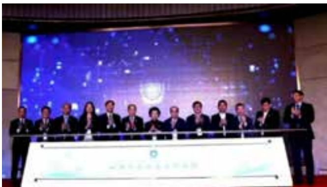
▲ 多家机构携手打造的上海市实验医学研究院正式揭牌。

上海市实验医学研究院正式揭牌。作为科研机构，该研究院以“无院墙”模式开放合作，实现共享共赢，打造“政产学研医防用资”八位一体创新平台。