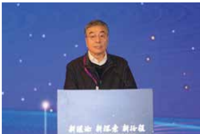
▲ 全国政协原副秘书长何丕洁主旨演讲