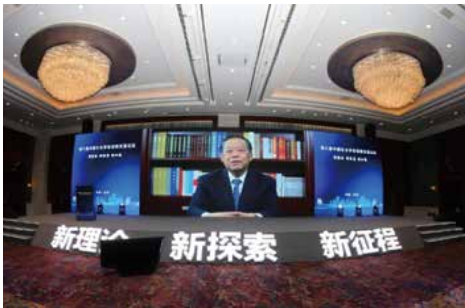
▲ 第十二届全国政协副主席刘晓峰通过视频方式致辞

第十二届全国政协副主席刘晓峰通过视频方式致辞，原卫生部部长高强，杭州市人民政府原市长孙忠焕，国务院参事室特约研究员、中国劳动学会会长、人力资源和社会保障部原党组副书记、副部长杨志明，中华全国新闻工作者协会原党组书记、副主席、书记处书记翟惠生，全国政协原副秘书长何丕洁，浙大城市学院校长，第十三届全国政协委员、民盟浙江省委副主委罗卫东，民政部法规司一级巡视员汤晋苏，中国水利文学艺术协会副主席、水利部离退休干部局原党委书记、局长凌先有，国家开发银行原董事、原中国再保险（集团）股份有限公司董事长庞继英，中国民族卫生协会会长吴英萍，中国小康建设研究会副会长范爱国、辜鑫龙，浙江省社区研究