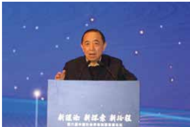
▲ 国务院参事室特约研究员、中国劳动学会会长、人力资源和社会保障部原党组副书记、副部长杨志明主旨演讲