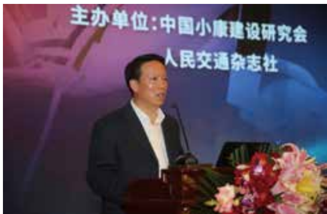
▲ 农业农村部合作经济指导司司长张天佐主旨演讲