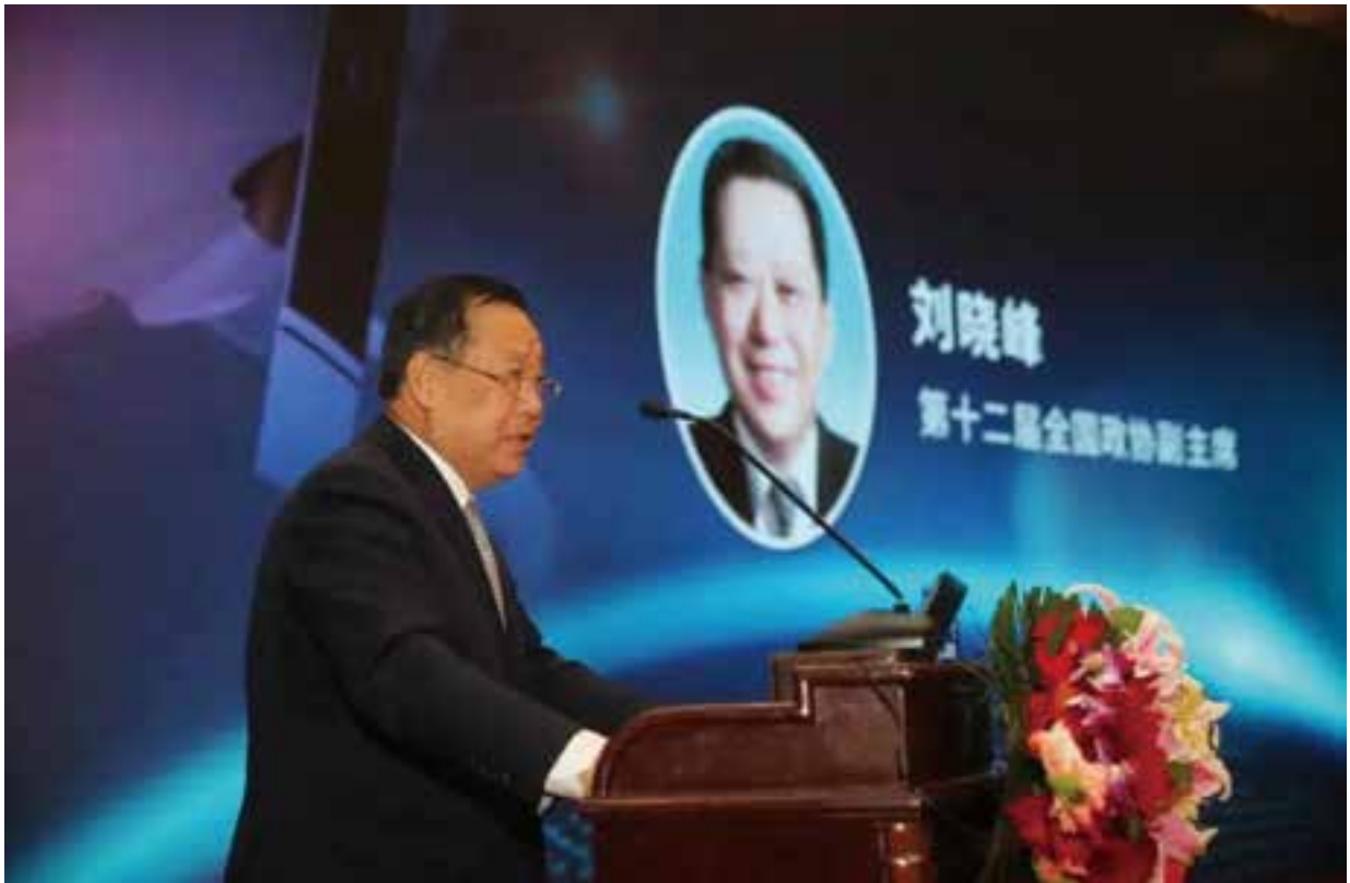
▲ 第十二届全国政协副主席刘晓峰致辞